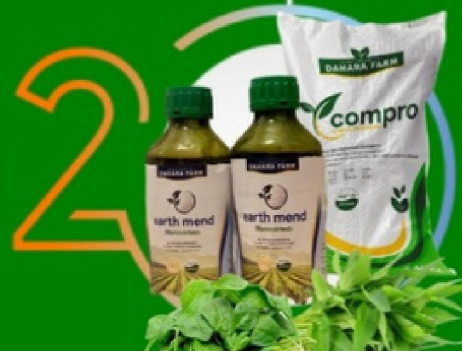
PEMBUATAN PUPUK ORGANIK DAN PEMBENAH TANAH