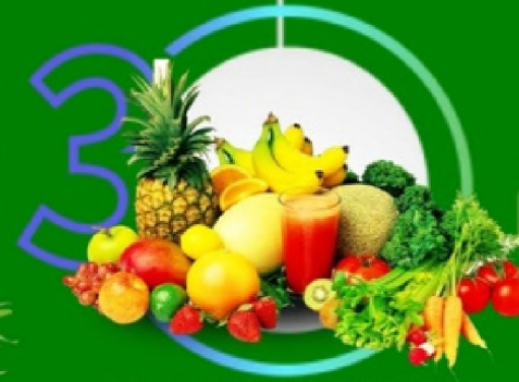
PERDAGANGAN PRODUK HORTICULTURA SAYUR DAN BUAH