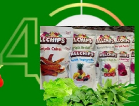
PENGOLAHAN PRODUK PERTANIAN DAN TURUNAN