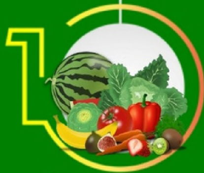
PERTANIAN HORTICULTURA SAYUR